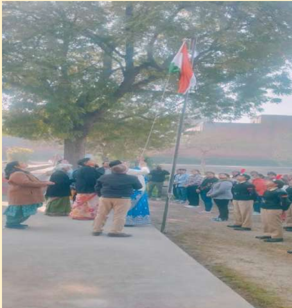
INDEPENDENCE DAY CELEBRATION