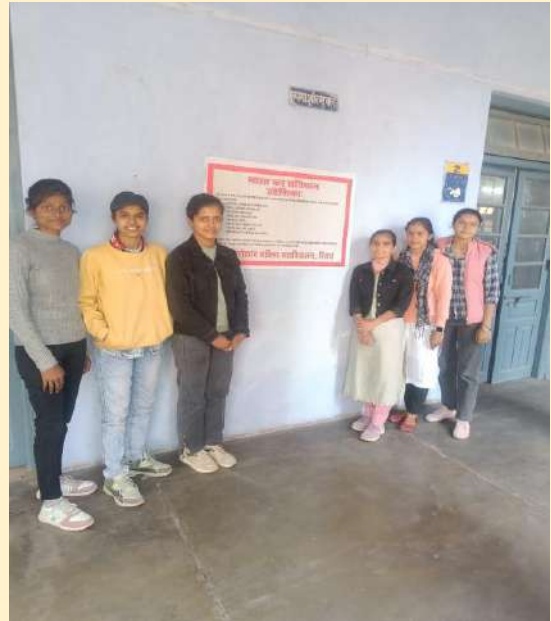
CELEBRATION OF CONSTITUTION DAY