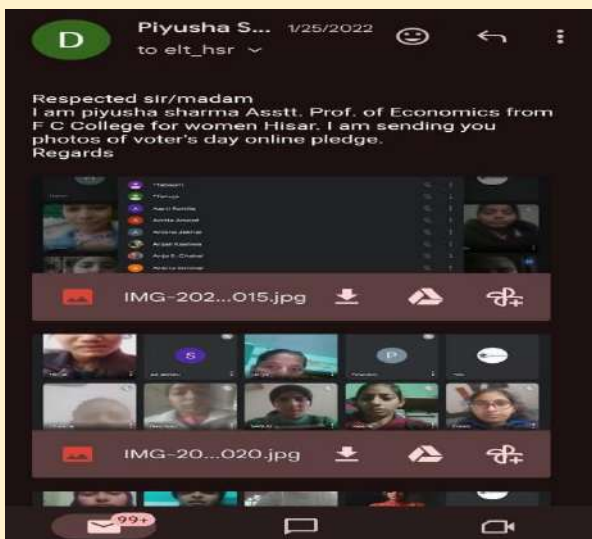
NATIONAL VOTER'S DAY