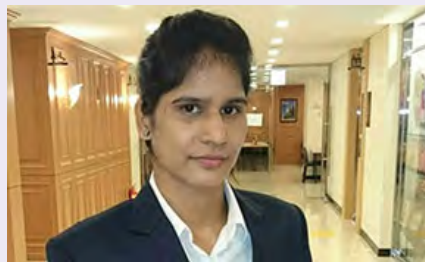
Pavitra Senior World Championship in Boxing