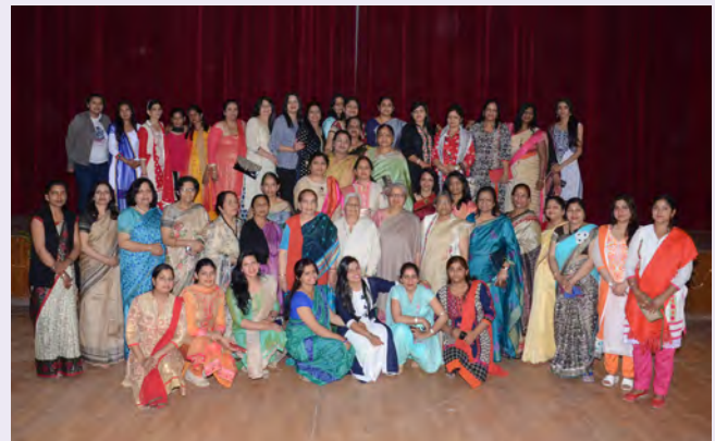
पूर्व छात्रा मिलन समारोह