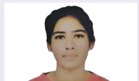
Laxmi World University Championship in Archery