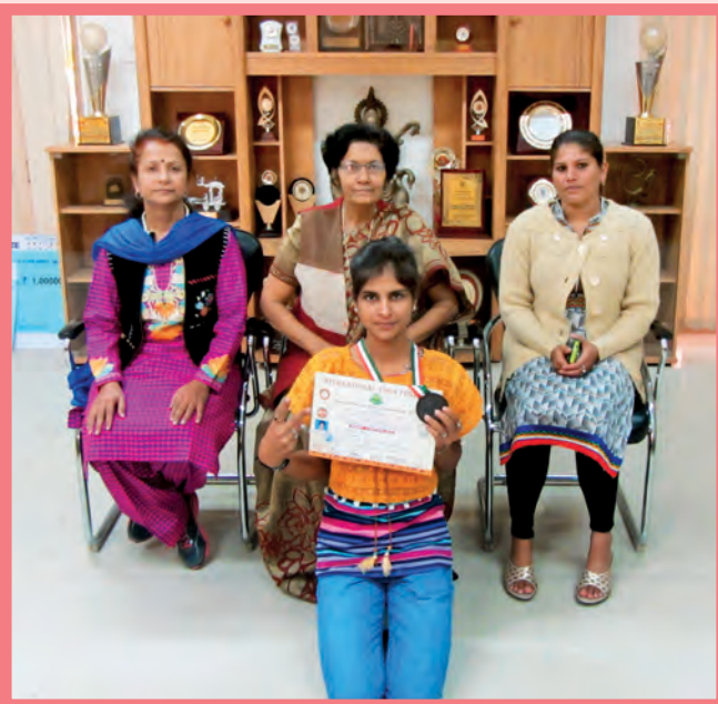
International Yoga Championship - 3 rd