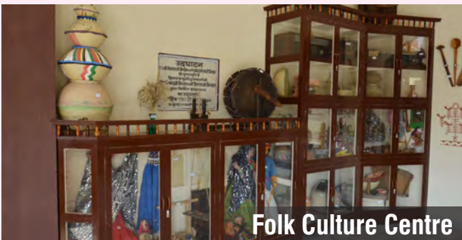
Folk Culture Centre