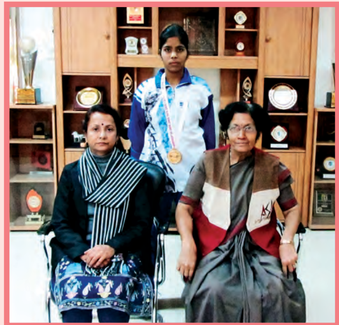
National Sambo Championship - 1 st