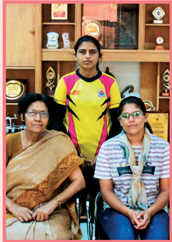
All India Inter University Wushu Championship - 3 rd