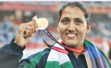
Krishna Poonia Padam Shri Awardee