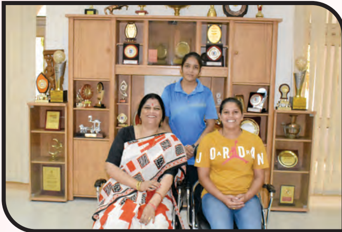
3 rd in Inter National Para Badminton Championship & participated in Inter National Para Badminton Championship