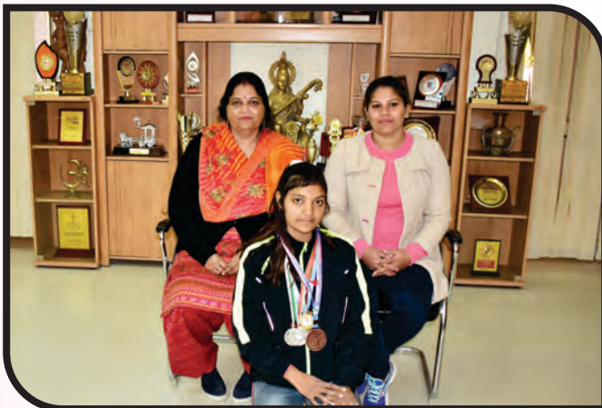
2 nd position in Yoga National Championship