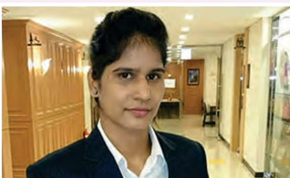
Pavitra Senior World Championship in Boxing