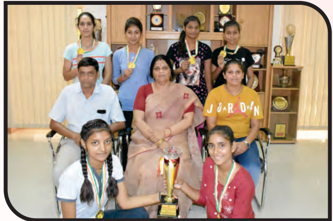
3 rd Position in All India Inter University Yoga Championship & 1 st Position in Inter College Yoga State Championship