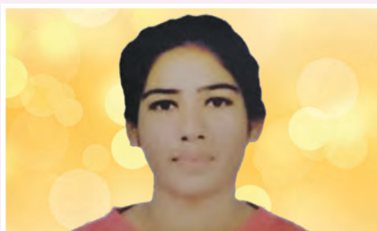
Laxmi World University Championship in Archery