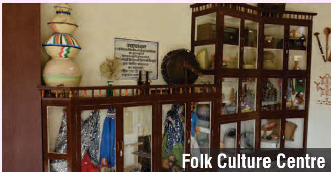
Folk Culture Centre