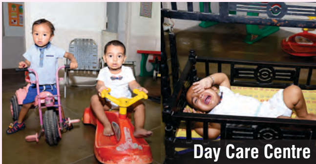
Day Care Centre