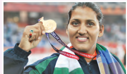
Krishna Poonia Padam Shri Awardee